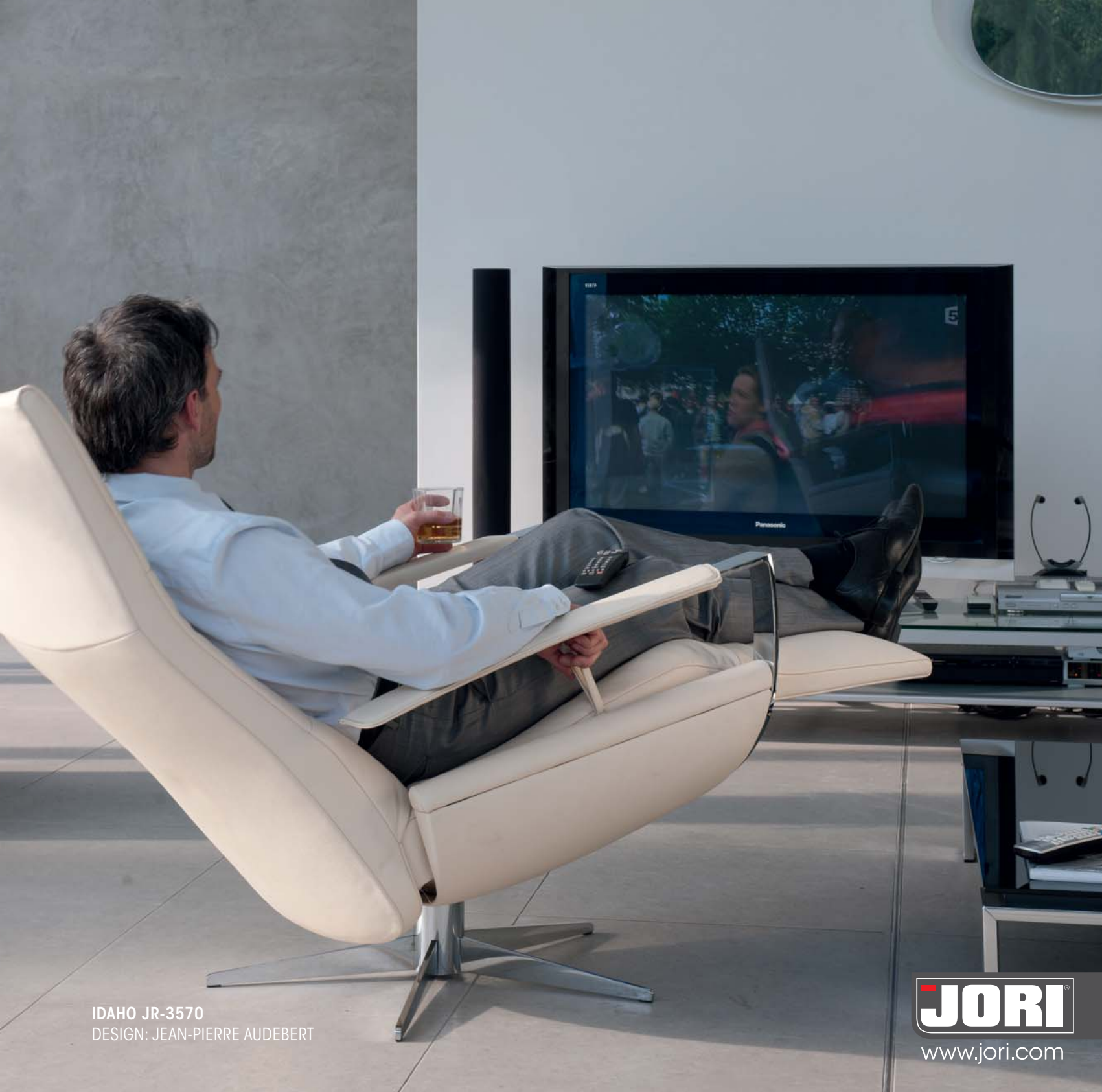
IDAHO JR-3570 DESIGN: JEAN-PIERRE AUDEBERT