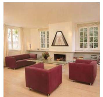
Publiciteitsfoto uit 1982

was de eerste Gelderland-bank met een afritsbare hoes uit één stuk, wat inmiddels standaard is bij het merk. Waar veel design uit de eighties nu pijn aan de ogen doet (en vaak ook aan het lijf) is de 4800 nog steeds een pure schoonheid. Veel geïmiteerd maar nooit overtroffen, dus met recht een klassieker binnen het Dutch Design. Ook verkrijgbaar als fauteuil, chaise longue en als extra diepe xl-versie. ►